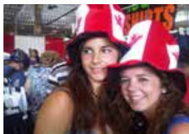
カナダ・イベント行事