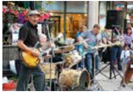
ビーチ・国際ジャズフェスタ