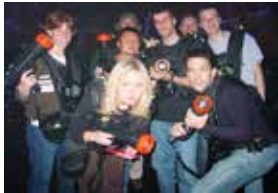
レーザータグ ゲーム