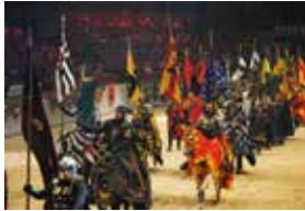
中世騎士ディナーショー