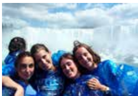
ナイアガラの滝 全日観光