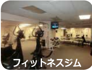
フィットネスジム