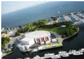
ウォーターフロント・コンサート