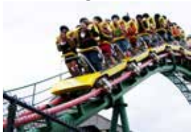
ワンダーランド遊園地