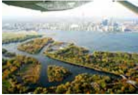
トロント・アイランド