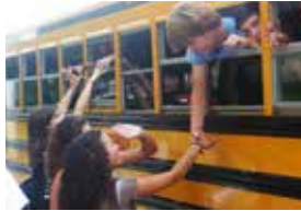
出発 - 空港見送り